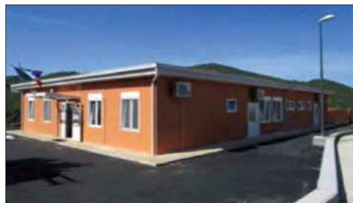
la scuola destinata all'accoglienza

deciso di creare un Comitato di accoglienza e di programmare incontri successivi per organizzare una raccolta fondi e del necessario per integrare nella Comunità Grumentina quanti giungeranno dalla lontana Ucraina. Piena soddisfazione dell'Amministrazione Comunale per le adesioni ricevute. In settimana prossima altro incontro operativo con Prefetto e Protezione Civile Regionale.